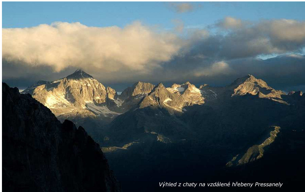
Výhled z chaty na vzdálené hřebeny Pressanely

Večer víno, špagety a mariáš. Chleba dochází. V noci bylo v našem pokojíku dost zima, ale spali jsme dobře.